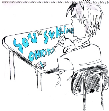
рис. Тодор Тодоров - 10 клас